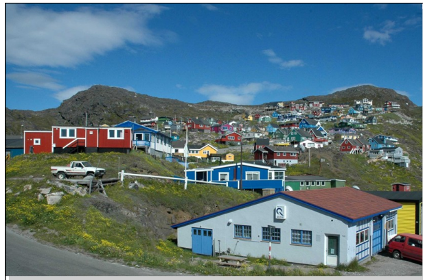
Wig-Wam Accommodation / Jaaraatooq Shop